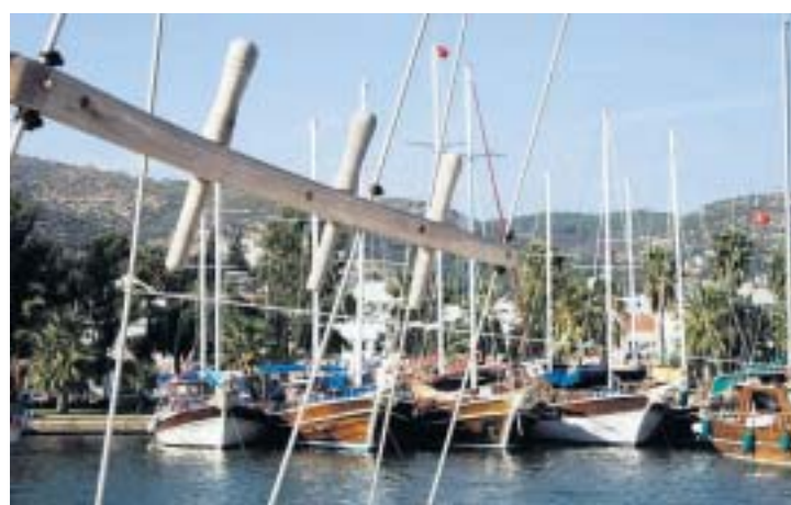
De haven van Bodrun.