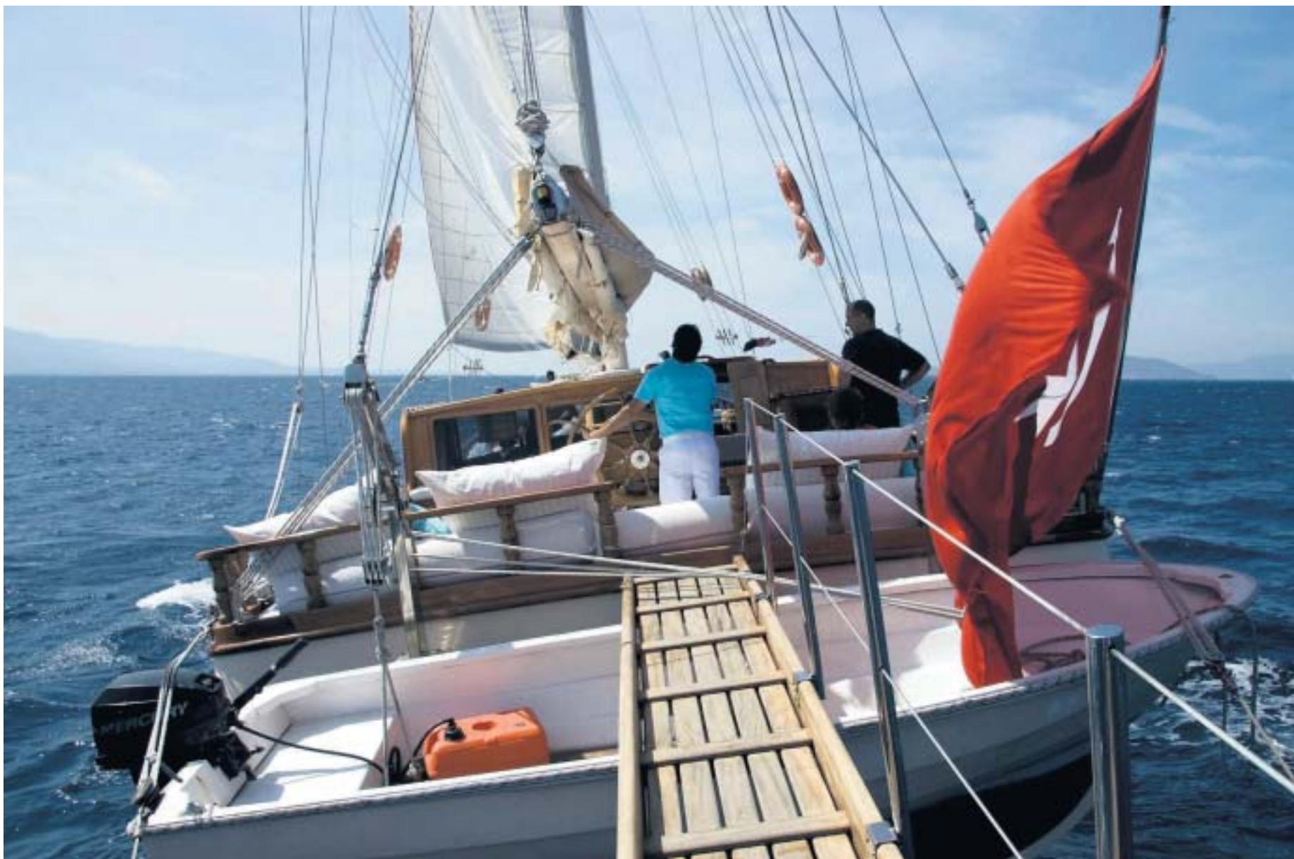
Zeilen met windkracht zeven op een Turkse ketch.