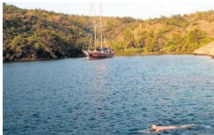
Zwemmen in een baaitje.