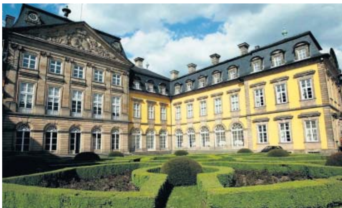
Het slot in Bad Arolsen waar koningin Emma werd geboren.

Tot en met 12 juni wordt in Südtirol de Vino in Festa gehouden. Vijftien wijnbouwstadjes, gelegen aan de Weinstraße, vormen het decor voor dit wijnfeest. Nieuw is de wijnsafari: een ontdekkingsreis langs de wijnroute. De wijnmaand wordt afgesloten met de Nacht van de Wijnkelders. www.suedtiroler-weinstrasse.it