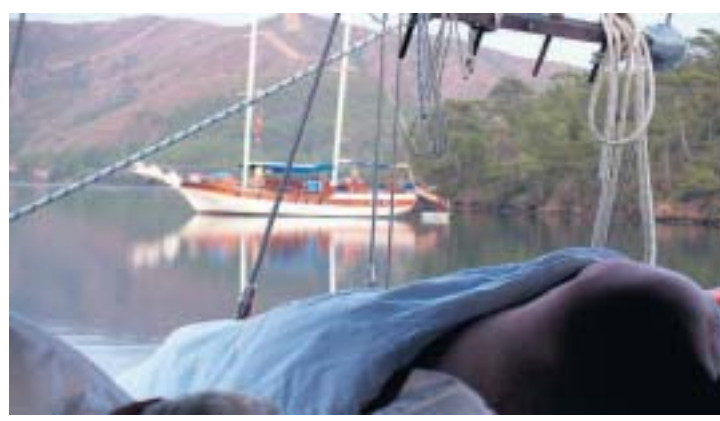
Slapen op het dek.