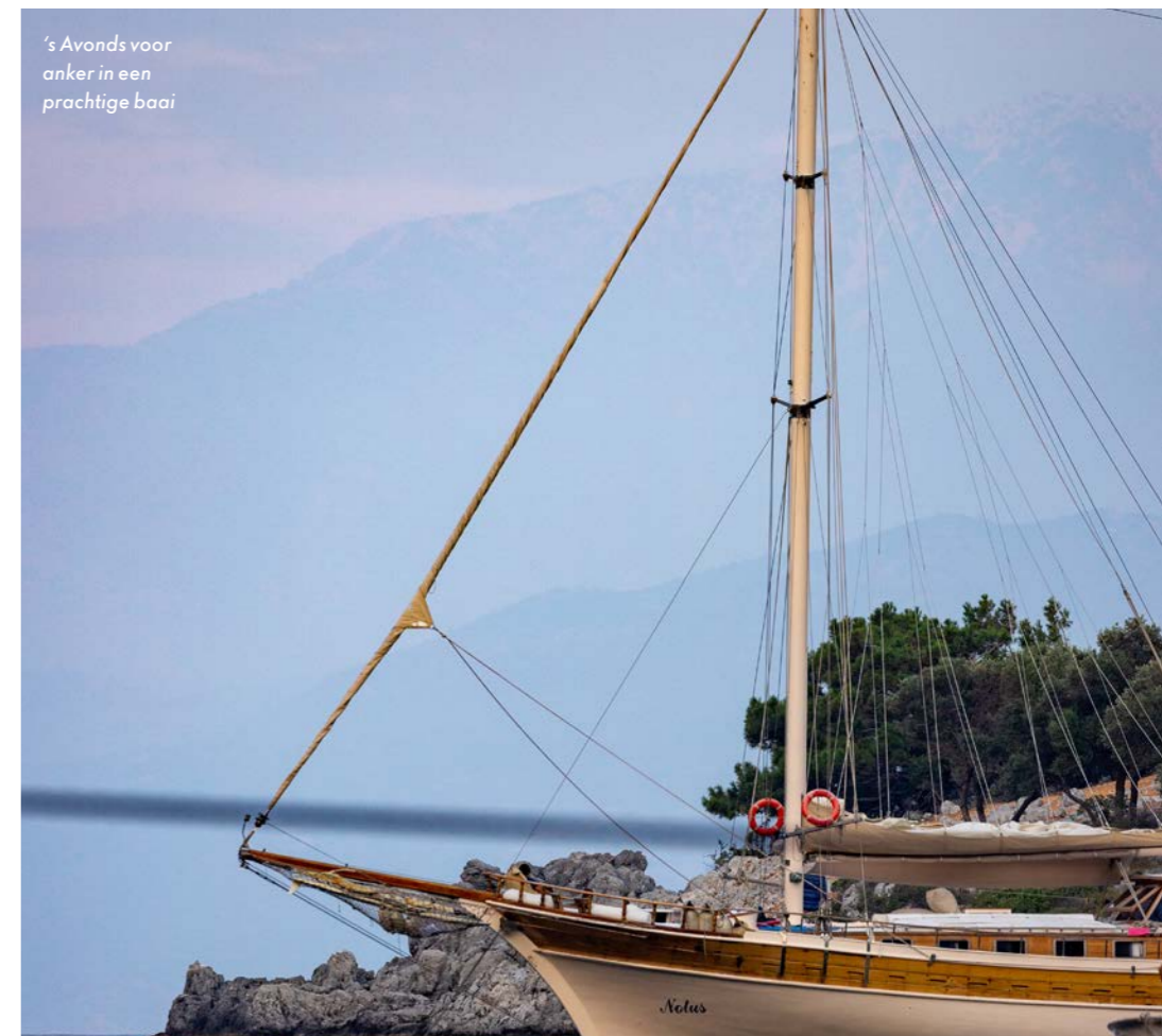
's Avonds voor anker in een prachtige baai