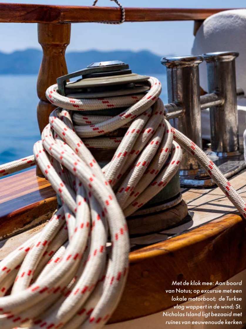
Met de klok mee: Aan boord van Notus; op excursie met een lokale motorboot; de Turkse vlag wappert in de wind; St. Nicholas Island ligt bezaaid met ruïnes van eeuwenoude kerken